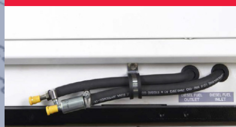
TUBO CARBURANTE ANDATA/RITORNO

L'intercooler W/A consente di svincolare completamente il gruppo elettrogeno dalle condizioni ambientali esterne, permettendo all'alternatore e al motore di lavorare a temperatura ideale ottimizzando il rendimento e l'affidabilità della macchina.