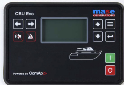
LOGICA DI CONTROLLO